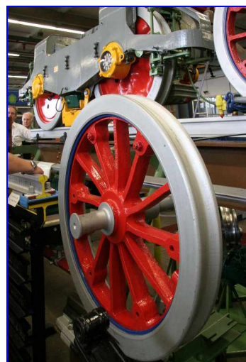
Modell der Antriebstechnik

Nach einem mehr flüssigen Imbiss ging es mit dem als „Schwebebahn-Express“ bezeichneten Bus im Schneckentempo nach Vohwinkel zu der Schwebebahnwerkstatt, wo dank der Zwangspause der Schwebebahn fast der gesamte Fuhrpark – auch der Kaiserwagen aus der Gründerzeit – versammelt war. Überall standen halb ausgeschlachte Wagen herum, die auf die regelmäßige Kontrolle und Reparatur warteten.