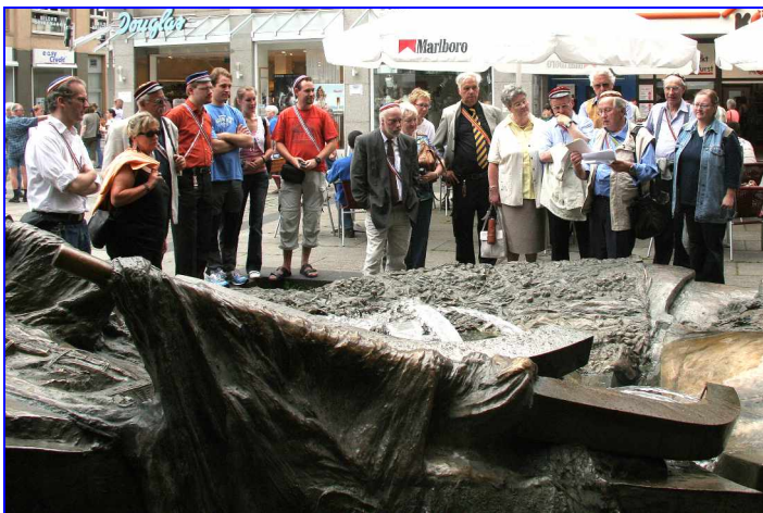
Pegasus erklärt den Brunnen »Das Tal der Wupper« am Rathausplatz, der die vielschichtige Historie von Wuppertal und dem Bergischen Land widerspiegelt.