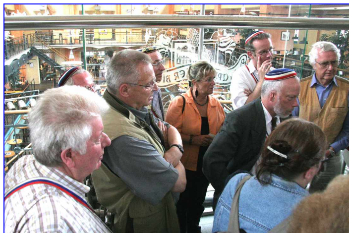
Ganze Bierfamilien sind fasziniert von der Bierherstellung hoch im Olymp des ehemaligen Schwimmbades.

Zunächst wurde uns die Kunst des Bierbrauens nahe gebracht und am Tank gezapftes Bier zeigte uns, dass die Anlage tatsächlich in Betrieb ist.