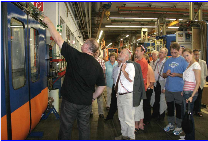
Hier wird die Funktion der Türsicherung erklärt.

Der Werkstattleiter hatte viel zu tun, den technisch interessierten Teilnehmern unserer Runde jedes Detail an den verschiedenen Schwebbahntypen zu erklären und auch zu dem Abriss und Neubau der Schwebbahnstation Vohwinkel – die aus der Wagenhalle gut einzusehen ist – wurde referiert. Der komplette Bahnhof wird zunächst in Moers aufgebaut, um sicher zu gehen, dass jedes Teil bei der Endmontage in Wuppertal auch passt.