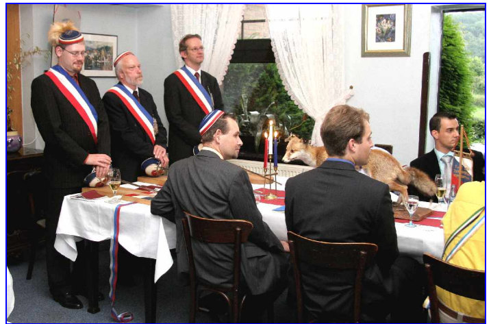
Das Kontrapräsidium aus Soest ...

Nach so vielen Unpässlichkeiten waren wir schließlich froh, um 18 Uhr in unserer Konstanten, dem Restaurant »Elfriedenhöhe«, unsere müden Knochen zum Abendessen ausstrecken zu können. Dass es mit dem Essen auch nicht nach Wunsch ablief, ist eine weitere Geschichte, die hier nicht noch einmal aufgewärmt werden soll.