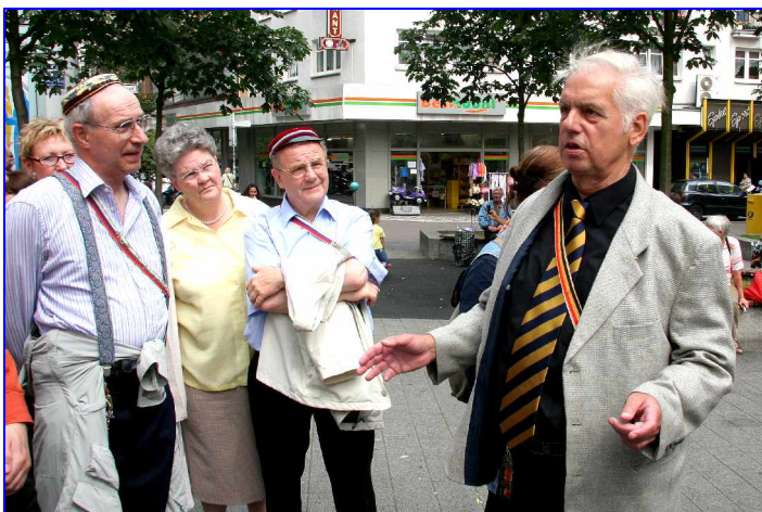
Schnurps, der ideale Führer durch Barmens Geschichte.

Eine Ortsringkneipe war schon lange fällig und hinsichtlich der Gegeneinladung zu einer Kreuzkneipe mit der I.C. Frankonia Susatensis zu Soest standen wir auch in der Pflicht – und so organisierten wir eine Mehrfarbenkneipe mit einem optimistisch geplanten Rahmenprogramm für unsere Gäste. Der unvorhergesehene Stillstand der Schwebebahn wegen Umbaumaßnahmen machte uns zunächst einen Strich durch die Planung, aber kurzfristig disponierten wir um: Zunächst führten uns Schnurps und Pegasus durch die Barmer Innenstadt.