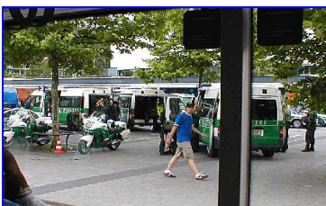
Dann waren wir plötzlich von Polizei umzingelt – Eskorte?

Die Besichtigung hat allen Teilnehmern gut gefallen - auch den Damen, für die eigentlich ein Bummel durch die Elberfelder Innenstadt geplant war. Dieser hätte böse enden können, da sich dort zur gleichen Zeit - anlässlich der 25. Wiederkehr der Wuppertaler Chaostage - Punks, Skins und Autonome mit drei Hunderterschaften Polizei prügeln, die gerade vom G8-Gipfel aus Heiligendamm zurückkamen. Auch wir wurden